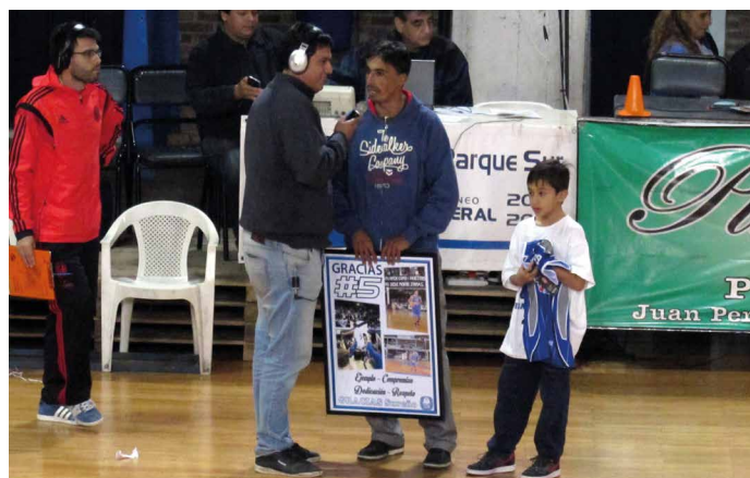
Antes del final de la temporada la Comisión de Básquet sureña le hizo entrega de un reconocimiento a su trayectoria en la institución.