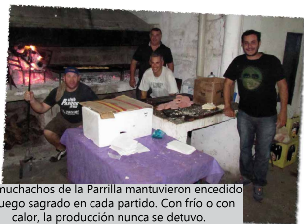
Los muchachos de la Parrilla mantuvieron encendido el fuego sagrado en cada partido. Con frío o con calor, la producción nunca se detuvo.