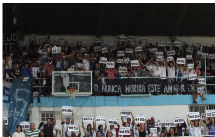
21 de Diciembre de 2014. El Clásico fue su último encuentro oficial. Su gente empapeló la tribuna visitante con un gigante "Gracias #5".

Pero en la noche de la gesta histórica, la del ascenso y del festejo eterno, su imagen fue otra. Con su hijo sobre sus hombros y trepado a la camioneta del equipo que ya había consumado el triunfo final, el Negro disfrutó como todos de este merecido ascenso. Ese ascenso que también le pertenece y que ya pasó a engrosar su extenso currículum vistiendo la gloriosa azul y blanca.