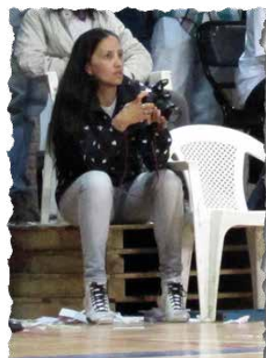
Pupé no pudo quedarse sin fotografiar la noche histórica del ascenso.