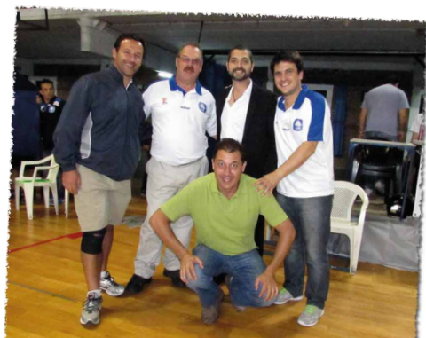
Jefe de Equipo, Asistente, Kinesiólogo y Del- egados del TFB también dijeron presente a lo largo de toda la temporada.