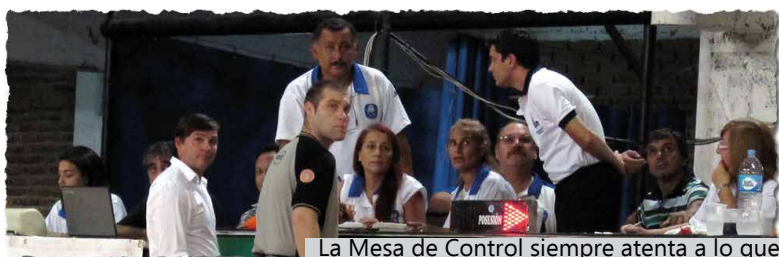
La Mesa de Control siempre atenta a lo que sucedía dentro del rectángulo.