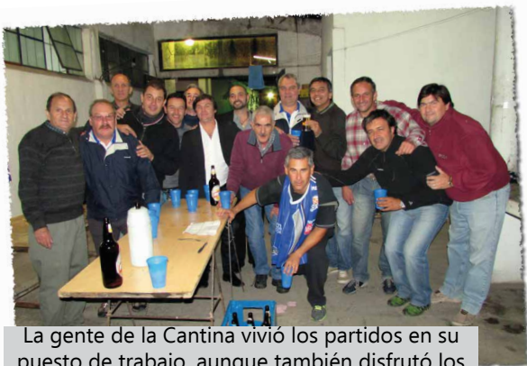
La gente de la Cantina vivió los partidos en su puesto de trabajo, aunque también disfrutó los festejos bien desde adentro.